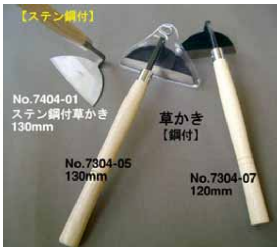
No.7404-01 ステン鋼付草かき 130mm