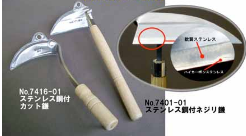
No.7416-01 ステンレス鋼付 カット鎌